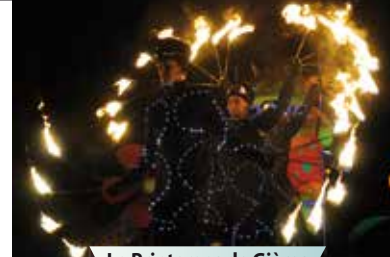
Le Printemps de Gières

Actions organisées en divers lieux de Gières (programme