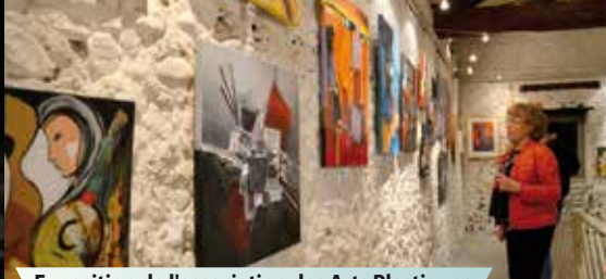
Exposition de l'association des Arts Plastiques