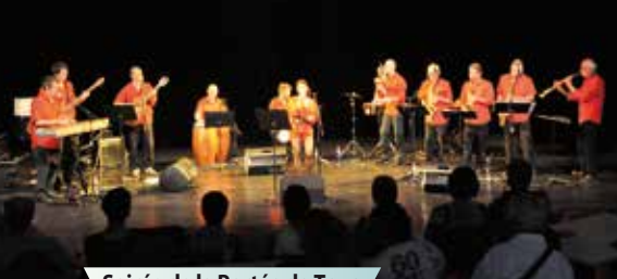
Soirée de la Portée de Tous