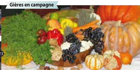
Gières en campagne