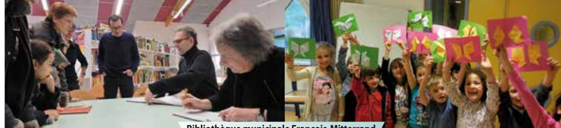
Bibliothèque municipale François-Mitterrand

Licences 1-107081413/ 2-1070814/ 3-1070815