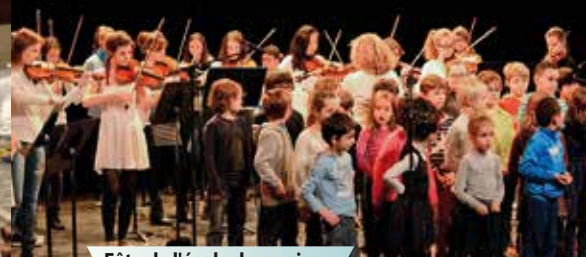
Fête de l'école de musique