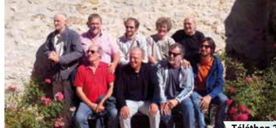
Téléthon 29 ème édition