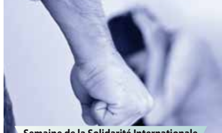
Semaine de la Solidarité Internationale