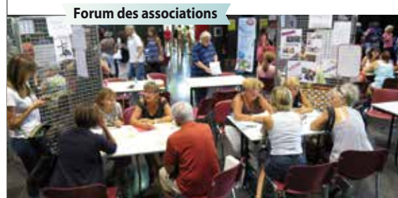
Forum des associations

Comme chaque année, en octobre, en ouverture de la « Semaine du goût », l'association Les Saveurs de Gières vous donne rendez-vous dans le cadre champêtre du parc Michal, pour une nouvelle édition de Gières en campagne. A partir de 9h, dans le parc Michal, marché des producteurs : vente, dégustation et rencontre avec des producteurs de l'agglomération, mais aussi découverte des créations sur tissus, bois, poterie... de certains de nos exposants. Pour les enfants : balades à dos d'ânes, maquillage... De 12h à 14h, au Laussy : les membres de l'association vous régaleront d'un menu composé à partir des produits locaux et de saison. Renseignements page suivante.