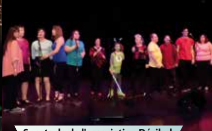
Spectacle de l'association Décibel