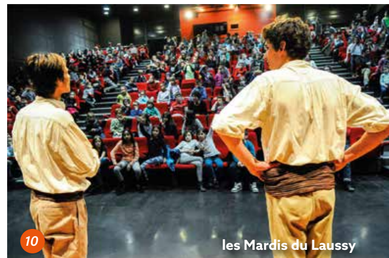
les Mardis du Laussy