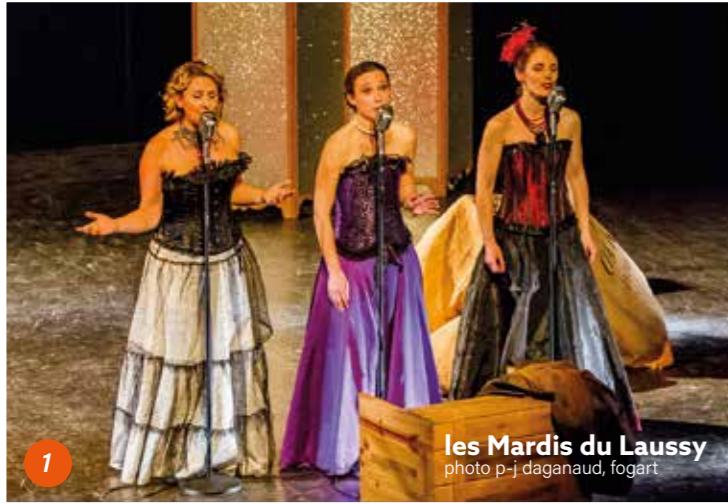
les Mardis du Laussy