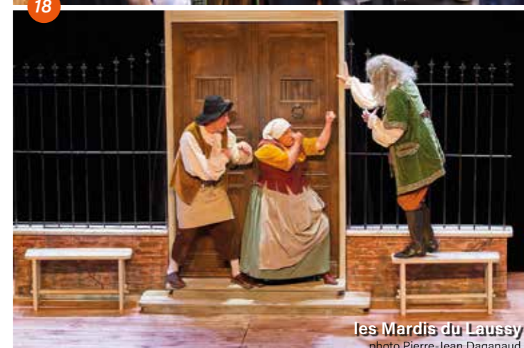
les Mardis du Laussy