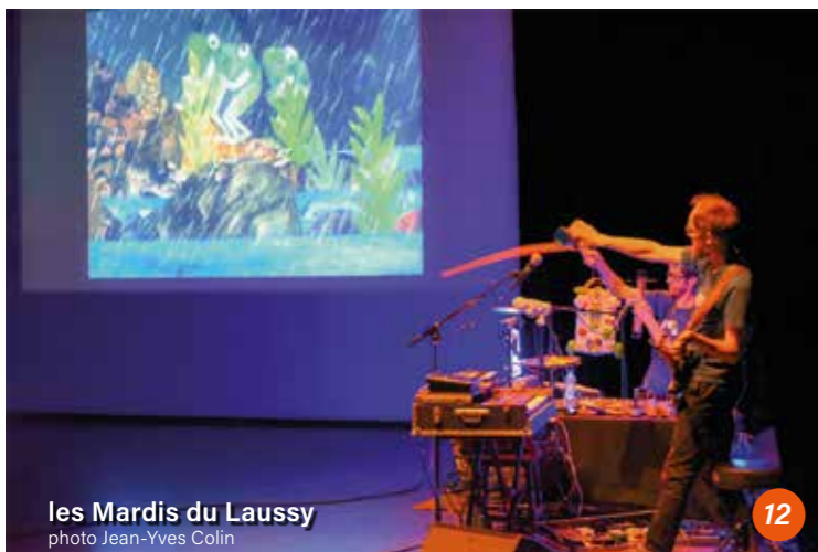
les Mardis du Laussy