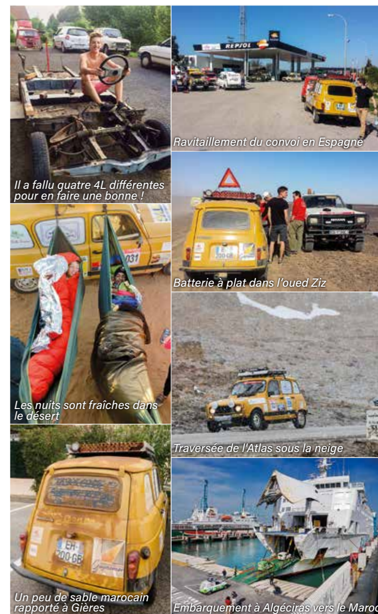
Ravitaillement du convoi en Espagne

Au final, plus que leur classement final (970 èmes après avoir longtemps figuré dans les 300 èmes ), tous deux en retiendront une belle aventure humaine, partagée avec les autres équipages venus de toute l'Europe, plus qu'avec les autochtones étant donné la taille de la caravane, et la satisfaction d'avoir triomphé des pistes de sable mou avec leur petite deux-roues motrices populaire.