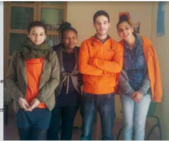
les Soirées du Laussy

Les bénévoles d'Unis-Cités engagés dans la mission "Une visite, un sourire" font beaucoup d'heureux ; « Les balades proposées par les jeunes me plaisent », précise Mme Anselme, tandis qu'une autre personne âgée ajoute : « J'aime bien nos discussions, cela me permet de me divertir et on joue aux cartes ».