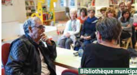
Bibliothèque municipale François-Mitterrand