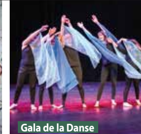
Gala de la Danse