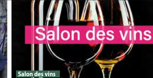
Salon des vins

Gières-Country vous invite à partager deux soirées animées par Nadine Gabaud avec au programme : country line dance !