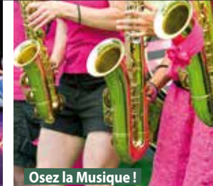
Osez la Musique !