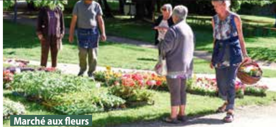
Marché aux fleurs

Soirée de clôture : vendredi 23 mars, à partir de 20h - Pensez à apporter une denrée alimentaire ! Rens. : Gières - Jeunesse : 04 76 89 49 12, contact.gieres-jeunesse@gieres.fr