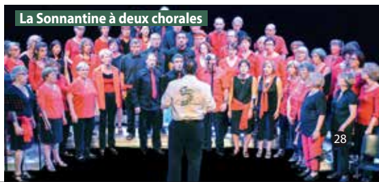
La Sonnantine à deux chorales

Les groupes de l'école municipale de musique, les musiciens et artistes amateurs locaux et les groupes professionnels mettront l'ambiance dans les différents quartiers de Gières pour finir sur le podium du parc Michal. Venez nombreux vibrer aux sons des voix et des instruments !