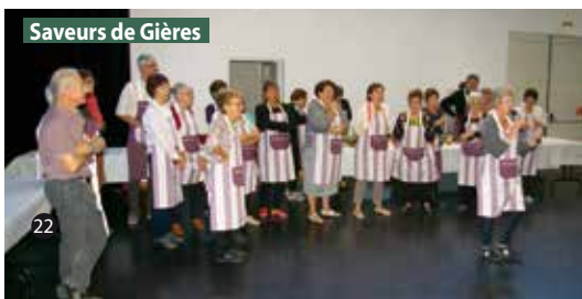
Saveurs de Gières