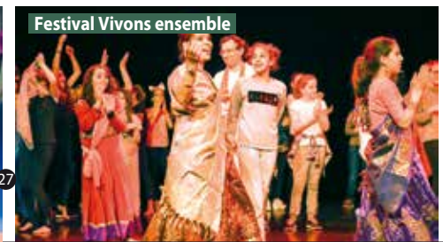
Festival Vivons ensemble