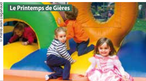
Le Printemps de Gières