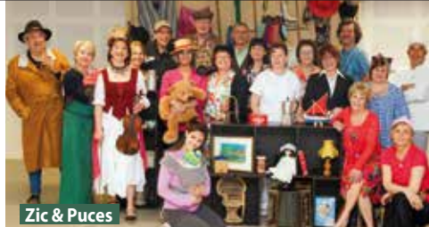
Zic &amp; Puces