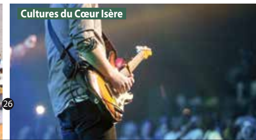
Cultures du Cœur Isère