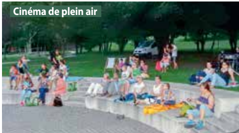
Cinéma de plein air