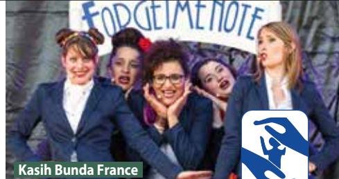
Kasih Bunda France