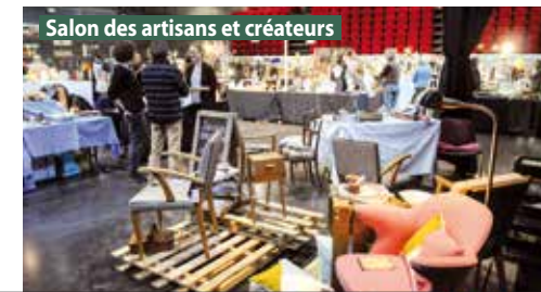
Salon des artisans et créateurs