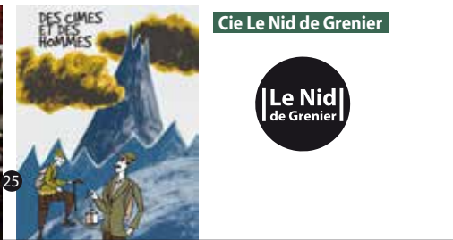
Cie Le Nid de Grenier