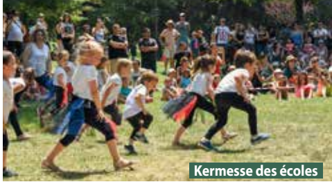
Kermesse des écoles

Buvette et petite restauration sur place. Rens. : 04 76 89 69 12, laussy@gieres.fr, ville-gieres.fr Dans les quartiers et parc Michal - Accès libre