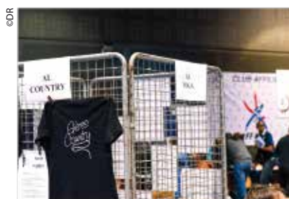
Forum des associations

Le Prix des Incorruptibles : pendant l'année scolaire 2019-2020, la bibliothèque participe au Prix des Incorruptibles ! ( www.lesincos.com ). Dès le mois d'octobre, les enfants et leurs parents pourront découvrir les livres des sélections CP et CE2/CM1 à la bibliothèque. Vous pourrez emprunter ces livres tout au long de l'année, participer aux divers jeux qui vous seront proposés et voter, en mai, pour votre livre préféré !