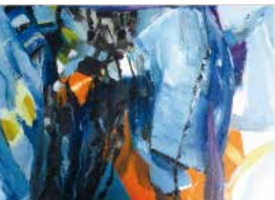
École supérieure d'art Grenoble-Valence