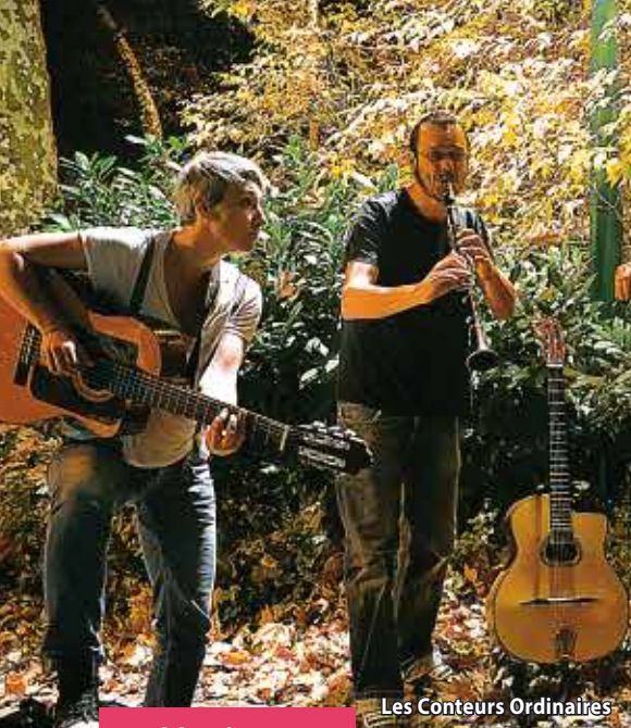
Les conteurs ordinaires