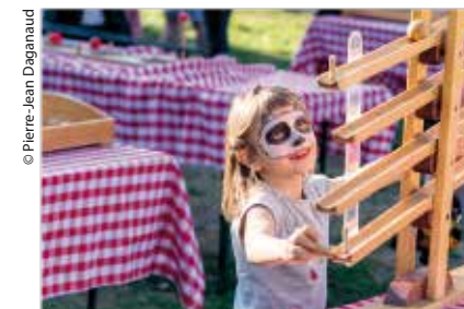
Le Printemps de Gières