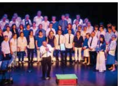
Concert de La Sonnantine à deux chorales

Le Laussy - Tarifs : 10 € (adultes) / 6 € (enfants/adolescents)