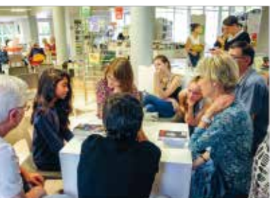
Bibliothèque municipale François-Mitterrand