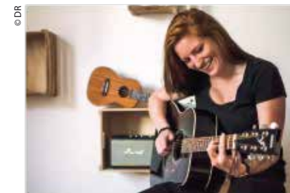
Chansons italiennes et internationales