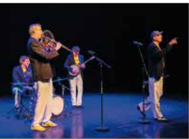
Les Mercredis dans la Grange