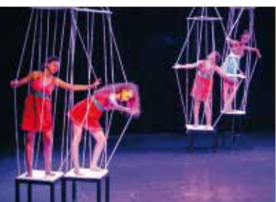
Gala de fin d'année de l'AL Gières Section Danse