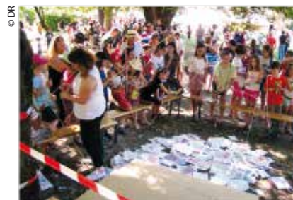
Kermesse des écoles