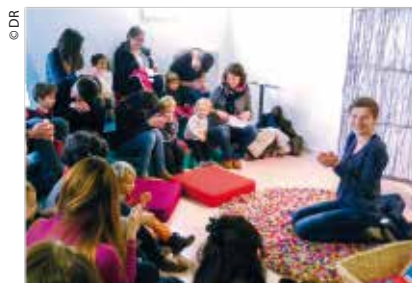
Bibliothèque municipale François-Mitterrand