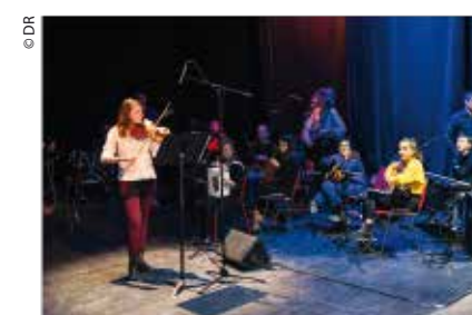
Musique amplifiée de l'EMM