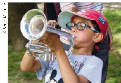
Osez la Musique !