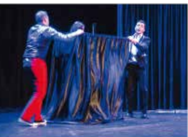
Gala de magie

Le Laussy - Tarifs : adultes : 15 € / moins de 12 ans : 12 €