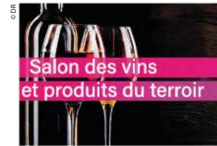
Salon des vins et produits du terroir