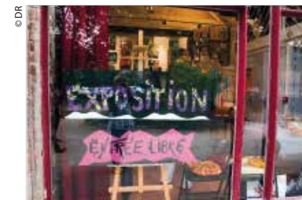
Exposition de l'association des Arts Plastiques