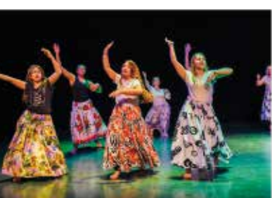
Festival « Vivons ensemble avec nos différences »