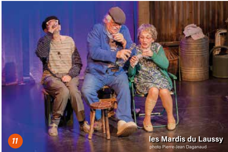
les Mardis du Laussy