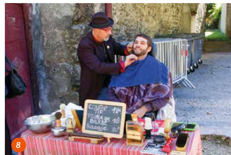
Les Mardis du Laussy