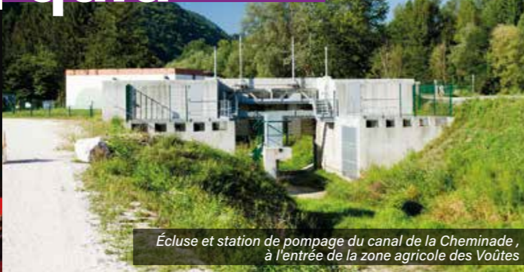
Écluse et station de pompage du canal de la Cheminade, à l'entrée de la zone agricole des Voûtes

Les communiqués à faire paraître dans le Gières info de janvier-février 2018 sont à faire parvenir avant le jeudi 30 novembre à jean-yves.colin@gieres.fr