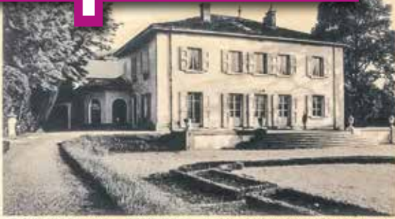
École de plein air des Alpes — GIERRES (Isère) La Maison, façade sur le Parc.