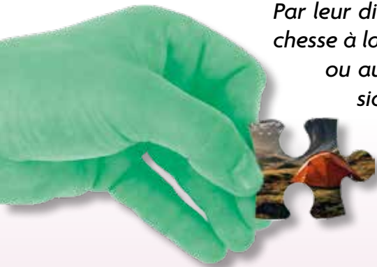
Bien Vivre à la Roseraie

Par leur diversité et leur dynamisme, les associations apportent une vraie richesse à la vie de la commune. Qu'elles soient nées au milieu du siècle dernier ou au début du mandat, ces structures font avant tout appel à la passion de leurs pratiquants et de leurs bénévoles, mais elles sont aussi soutenues par la ville, comme le détaille le maire-adjoint à qui cette délégation a été confiée.