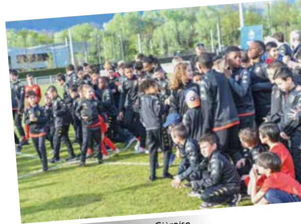
Union Sportive Giéroise

... en sus des équipements sportifs et d'un réseau de salles mis gracieusement à la disposition des associations pour leurs pratiques