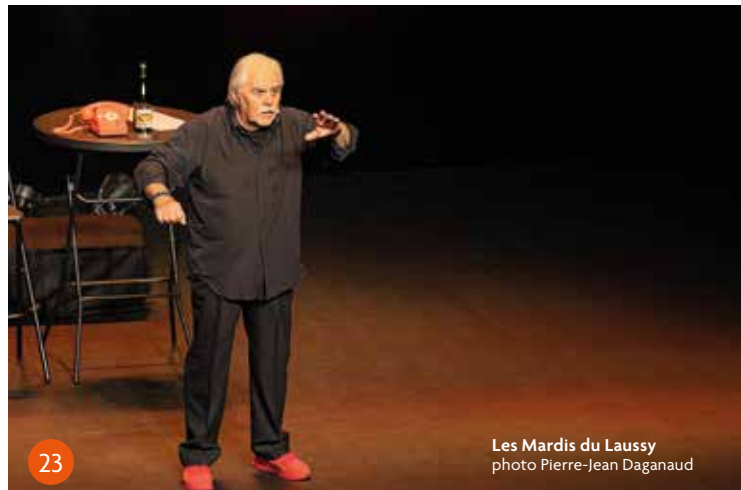
Les Mardis du Laussy

Fin de cycle pour les Maudru ; Serge Papagalli renoue avec le « solo donc tous seul » pour son nouveau spectacle, Les Guêpes aiment l'andouillette , et où — sacrilège — il n'adopte pas toujours son accent dauphinois ! Mais le fond reste le même, il s'agit toujours de « rire des choses ridicules que les humains font », et le public demeure fidèle, le Laussy affichant complet, comme toujours, plusieurs semaines avant la date de la représentation