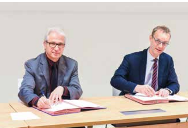
La procédure de "rappel à l'ordre" a été renforcée il y a un an par la signature d'une convention entre la ville et l'institution judiciaire, représentée par Eric Vaillant, procureur de la République