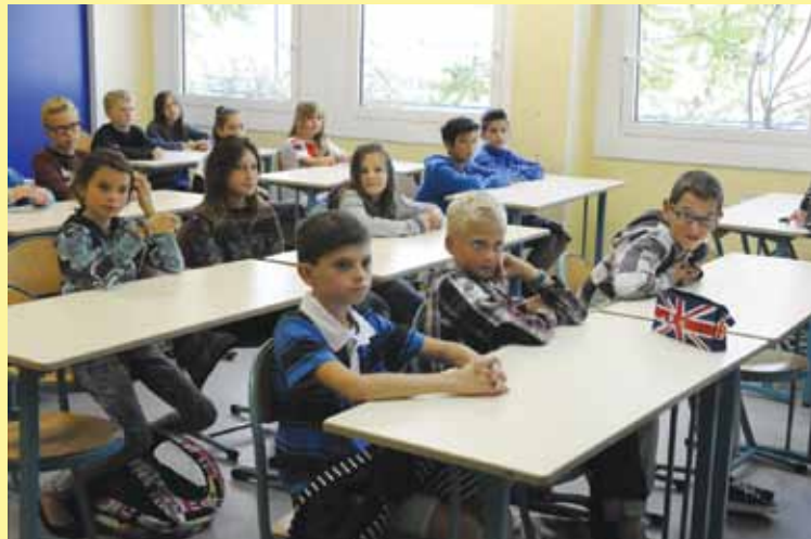
Le collège Le Chamandier compte sept classes de 6ème, vingt classes au total