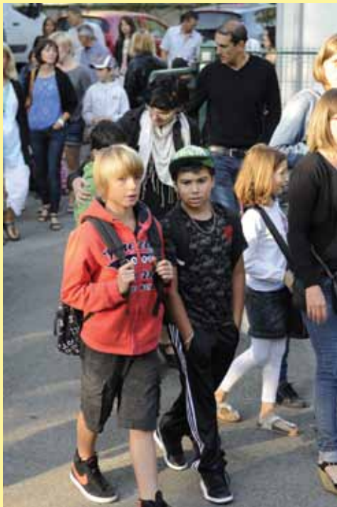
A l'école primaire René-Cassin, les plus grands affichent une aisance de circonstance