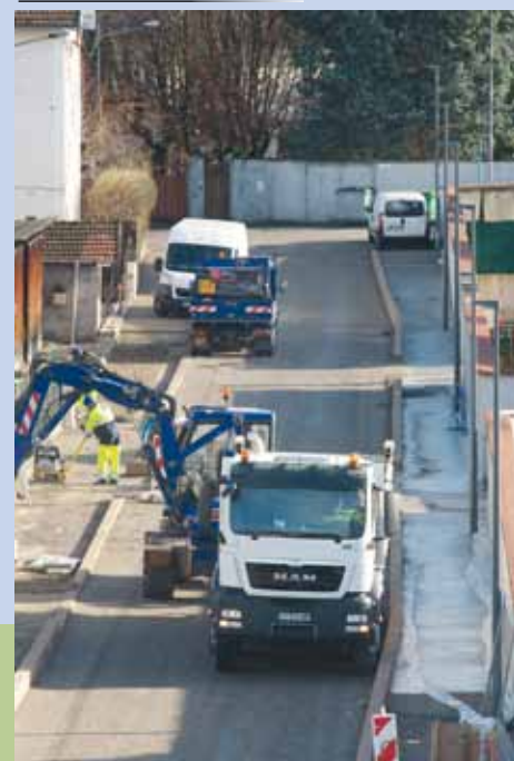
L'éco-quartier du Petit-Jean