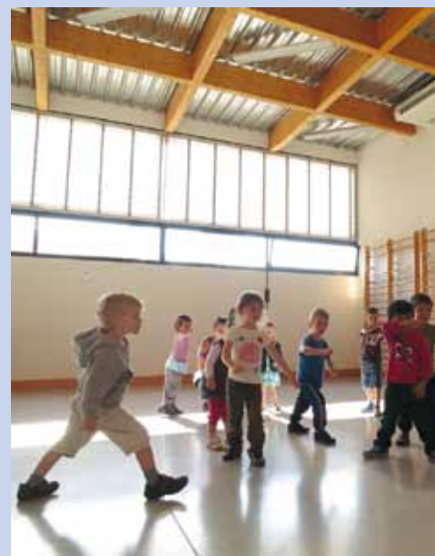
La réforme des rythmes scolaires