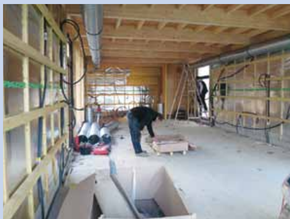
Les salles de rencontre de la Plaine des sports