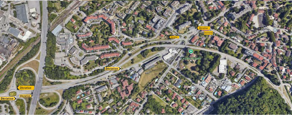
Plan deviation - Rond point